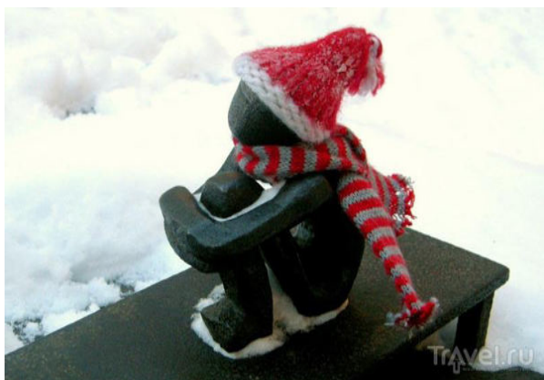
рис.6 Мальчик, смотрящий на Луну

Быть железным, но не быть черствым, уметь несмотря ни на что, наставлять себя и находить свой истинный путь, знать, в какой момент уже пора остановиться, отпустить детство и отправиться в свободное плавание, позволив себе развиваться самостоятельно. И всегда знать, что за плечами твоя семья, которая обогреет, подбодрит, поможет материально и морально.