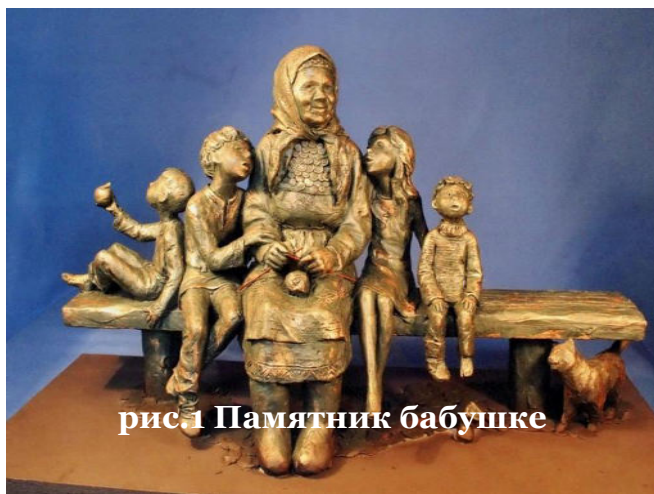
рис.1 Памятник бабушке