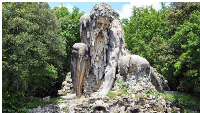
рис.2. Аллегория Апеннин

А начали мы, конечно, с понятия аллегория. Аллегория (от др.-греч. ἀλληγορία — иносказание) - иносказание, выражение чего-нибудь отвлечённого, какой-нибудь мысли, идеи в конкретном образе. И